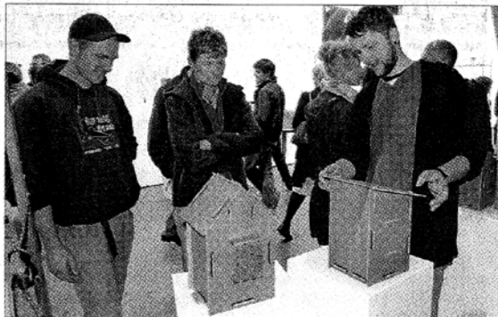
Zahlreiche Interessierte besuchten am Sonnabend und Sonntag die Ausstellung auf dem Werkhof in Kukate – und ließen sich auch die Vogelhäuschen erklären.